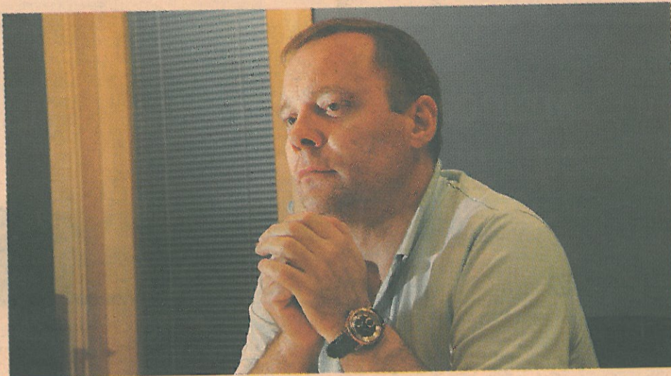
DIEMSBIZNESIS