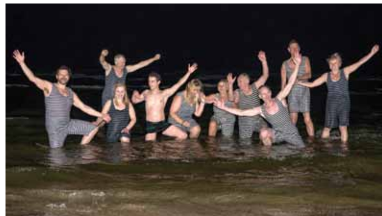
Vēlu vakarā Majoru pludmalē norisinājās nakts peldes rituāls Raiņa stilā, kur, Raiņa peldkostīmos tērpti, pretī jūras viļņiem devās Latvijas Ziemas peldētāju kluba „Latvijas roņi” peldētāji.