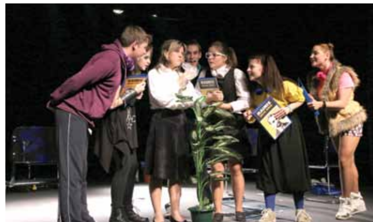
Jūrmalas jauniešu teātris „Rainis un Co” ar izrādi „Stikla kalna mantinieki” saņēma balvu nominācijā „Par komandas darbu izrādē”.

Sanija Šupulniece, Jūrmalas Kultūras centrs