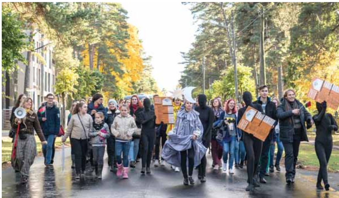
Teātra festivāla dalībnieki devās gājienā pa Muižas ielu uz festivāla norises vietu – Jūrmalas teātri.

Noslēdzies pirmais Latvijas jauniešu teātru festivāls konkurss „Rainis un Aspazija tev”, kas bija veltīts abu dižgaru daiļradei, aizvadot 150. jubilejas gadu. Laimīgas un starojošas jauniešu sejas, radoša un draudzīga gaisotne, daudzveidīgas izrādes – tas viss divu dienu garumā 23. un 24. oktobrī Jūrmalā!