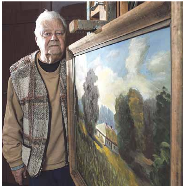
Mākslinieka glezns izstāro prieku, Latvijas dabas ainavu daudzkrāsainību, ziedu krāšņumu, jūras un saules krāsu saspēli.