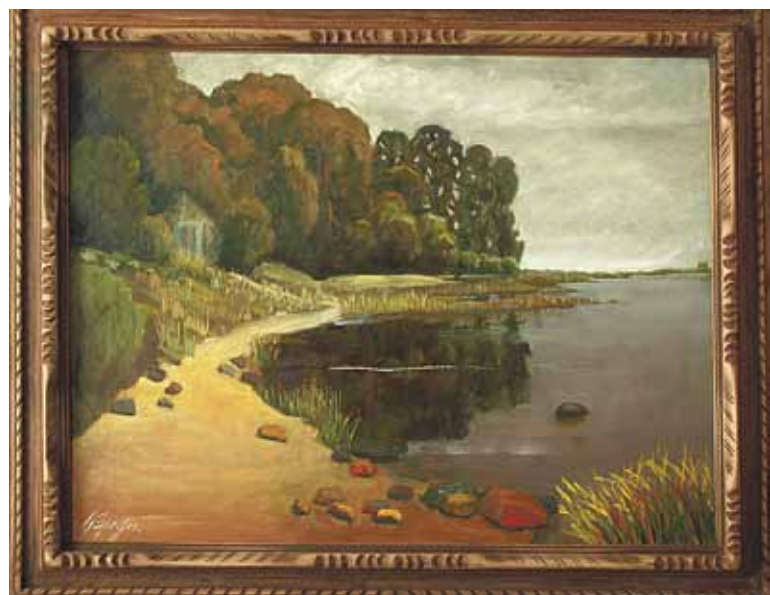
Gunārs Dainis Sproģis. No izstādes darbiem.

5. novembrī plkst. 17 Jūrmalas Mākslas skolā tiek atklāta izstāde „Septiņas valstības”, kurā būs apskatāmi multimedijālās mākslinieces Sabīnes Moores sātīgi krāsainie papīrgriezuma tehnikas ilustrācijas darbi un instalācija, kas tapusi, rotaļājoties ar papīru.