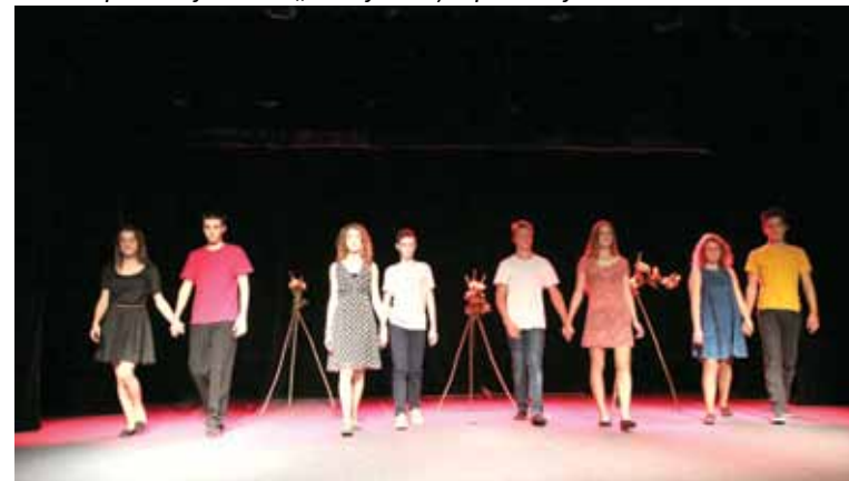
„Romantiskākā izrādē” – Majoru vidusskolas teātra iestudējums „Nekur vairs puķes nezied tā”, kas veidots pēc Aspazijas dzejas motīviem.