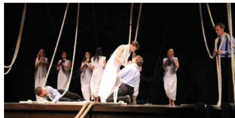
Jūrmalas Kultūras centra Kauguru kultūras nama jauniešu teātra „Eksperiments” iestudētā luga „Jāzeps un ...” konkursā atzīta par idejiskāko izrādi.