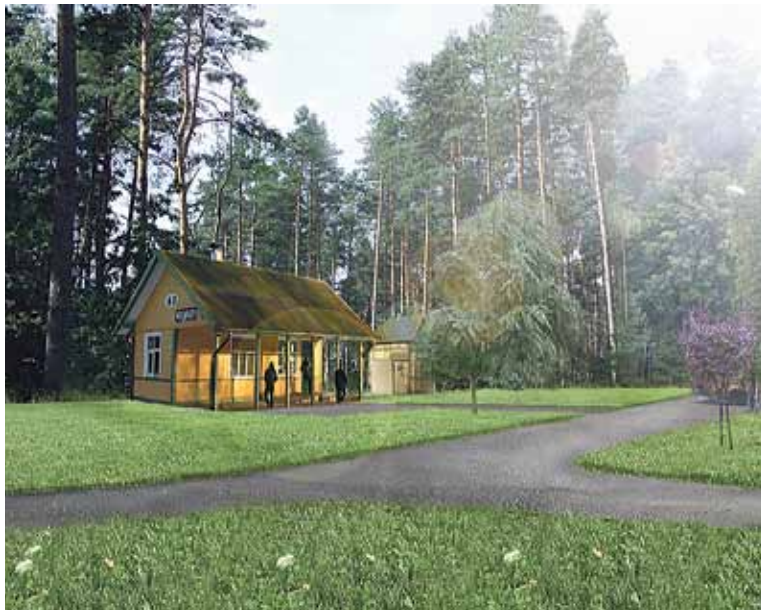
Vēsturiskā Vaivaru stacijas ēka tiks saglabāta kā kultūrvēsturisks arhitektūras piemineklis un pārvietota tālāk, Skautu ielas malā.

Lai paspētu pabeigt projektus laikā un mazāk traucētu vilcienu