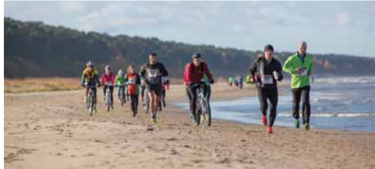
Skrējējus priecēja ne tikai trases dažādība, bet arī krāšņās rudens ainavas, saulainais laiks un svaigais jūras gaiss.

Taku skrējiena mērķis bija iepazīstināt ar jaunām un interesantām skriešanas vietām Jūrmalas pilsētā un tās apkārtnē. Distanču dažādības dēļ pasākums ir pieejams visu dzimumu un vecumu sportot gribētājiem, kā arī aizraujošs Jūr-