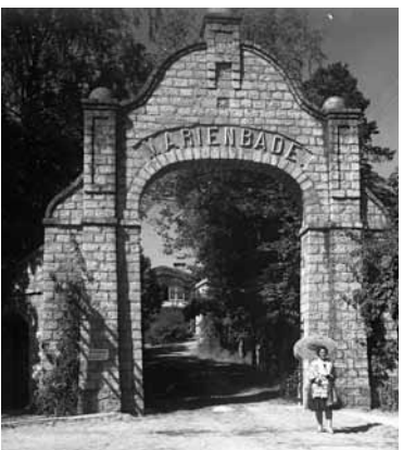
Kinolektorijis aicina caur dažādu laiku kinokadriem iepazīties ar Jūrmalas vēsturi, attīstību, vidi, cilvēkiem un notikumiem. Jūrmala. Pagājušā gadsimta 30. gadi.

13. novembrī plkst. 18 Jūrmalas Kultūras centrā notiks kinolektorijis par Jūrmalu – kinohroniku programma un lekcija, kas ar dažādu laiku kinokadru palīdzību uzskatāmi stāstīs par pilsētas vēsturi, attīstību un personībām.