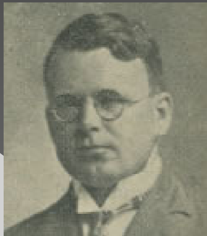
◉ Fēliks Cielēns (1921)