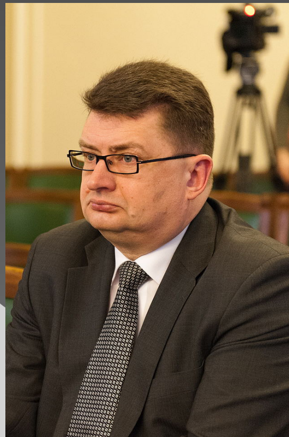
Jānis Maizītis Ģenerālprokurors (2001)