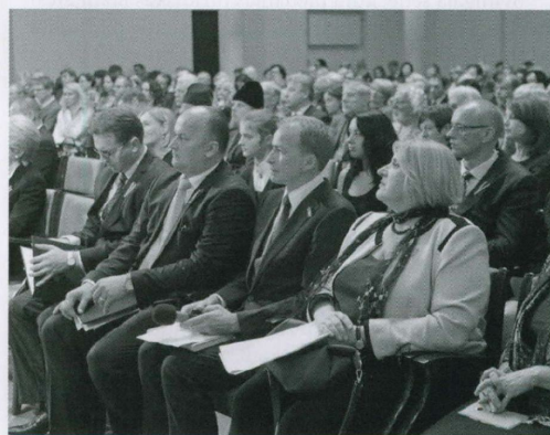
Jaunākās Satversmes komentāru grāmatas atklāšanas pasākumā piedalījās gan vairāki desmiti projekta īstenošanā iesaistīto cilvēku, tostarp autori un zinātniskā redakcija, izdevējs, atbalstītāji, gan plašā pārstāvniecībā aicinātie viesi.