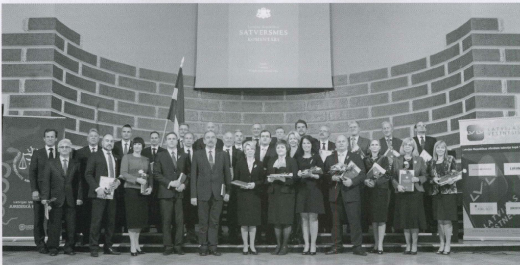
Jaunās Satversmes komentāru grāmatas autori, zinātniskā redakcijā, projekta atbalstītāji un aicinātie viesi

Pēc trīs gadu darba un vairāku desmitu cilvēku iesaistes ir noslēdzies vēl viens Latvijas Republikas Satversmes zinātnisko komentāru projekts, kas piepūlējās diviem iepriekšējiem un šajā reizē veltīts valsts pamatlikuma ievadam un pirmajai nodaļai jeb vispārējiem noteikumiem. Tādējādi lakoniskās Satversmes saturs un būtība zinātniskā skatījumā šobrīd jau izvērsti apmēram pusotra tūkstoša lappušu apjomā, bet darbs pie komentāriem aizvien turpinās, jo ārpus tiem palikušas vēl vairākas pamatlikuma nodaļas.